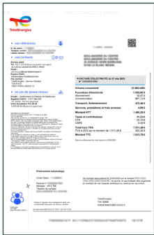
Une première page affichant le montant global de votre facture